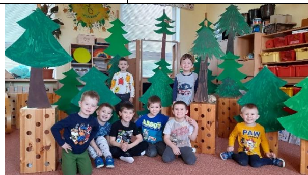
V lese jsme se nebáli a zažili jsme spoustu zajímavého

Dětem se jejich první autorské knižky moc povedly a dokázaly tím, co už se všechno po dobu docházky do školky naučily