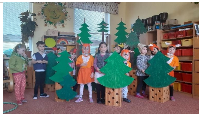
Velmi oblíbené byly dramatizace známých pohádek O Budulínkovi a O Smolíčkovi

Konečně jsme se mohli setkat zase s kamarády ve školce a od září si společně hrát, zkoušet nové věci a učit se vzájemně jeden od druhého. I když epidemie svíštěla všude kolem nás, děti z naší třídy zažily karanténu jen dva dny v lednu a jeden den v únoru.