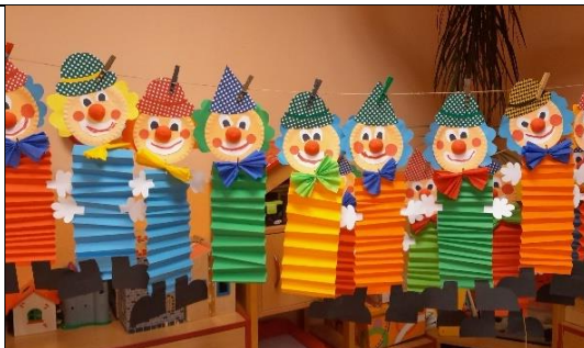
Užili jsme si spoustu legrace a zábavy při karnevalovém dopoledni – masky byly překvapivé

Konečně jsme se mohli setkat zase s kamarády ve školce a od září si společně hrát, zkoušet nové věci a učit se vzájemně jeden od druhého. I když epidemie svíštěla všude kolem nás, děti z naší třídy zažily karanténu jen dva dny v lednu a jeden den v únoru.