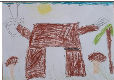
To je náš svět – plný fantazie a příběhů

V březnu jsme se věnovali dětským knížkám, příběhům a tvorbě vlastní knížky, jejíž obsah byl sestaven z jednotlivých úkolů a výtvarných technik, které děti zvládly během tří týdnů