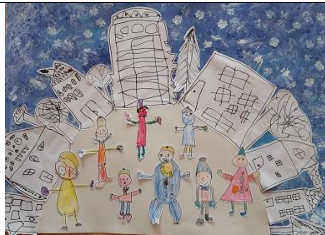
Zimní období přineslo tvoření i pokusy s ledem a sněhem.